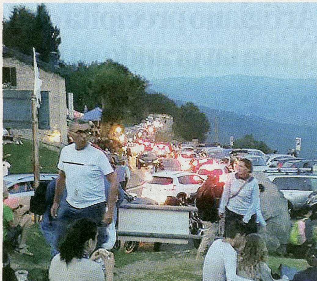
Le auto incolonnate sulla strada che porta all'osservatorio alla Colma di Sormano

■ E a notte fonda arrivano i carabinieri. I timori del sindaco Astrofili soddisfatti