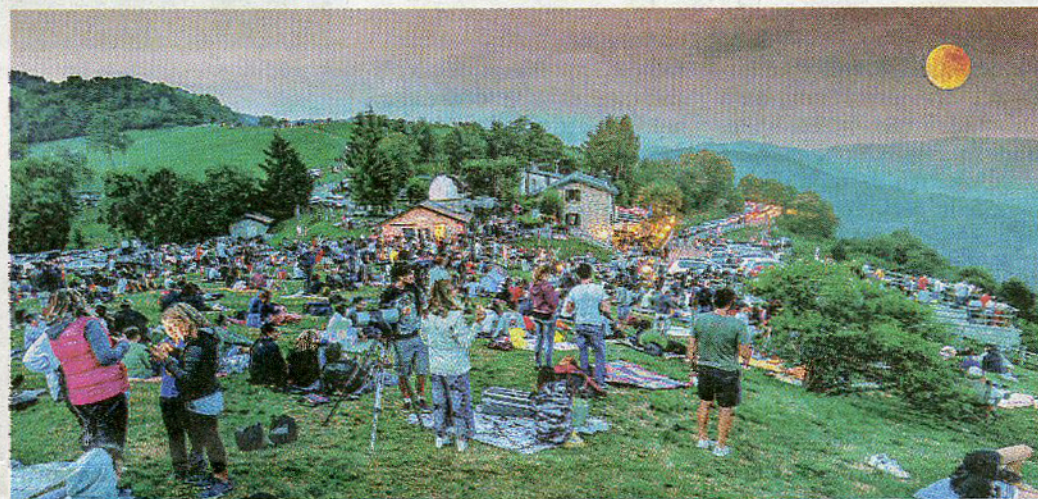
Nel fotomontaggio (la luna è fuori posizione) l'attesa di migliaia di persone alla Colma per l'eclissi