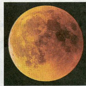
L'eclissi di luna rossa